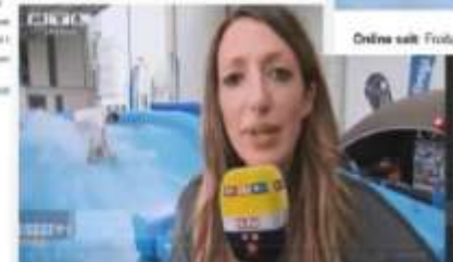
Online vom Freitag, 19.08.2016 Bewertung: ★★★★★