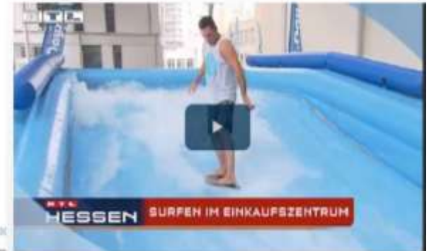
Online vom Freitag, 16.08.2016 Bewertung: ★★★★★